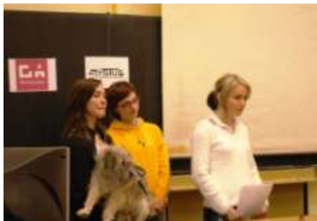
Studentky 1.G prezentují svůj projekt

Komentář koordinátora: Musím se přiznat, že jsem zpočátku tomuto projektu trochu nevěřil, ale náš druhý nejmladší projektový tým mě i hodnotící komisi přesvědčil o tom, že jde o technologii, která může být radě lidí v praxi prospěšná a kritérium společenské užitečnosti projektu je rozhodně naplněno. Hodnotící komise plánovaný rozpočet zkrátila vzhledem k poněkud předimenzovaným požadavkům na občerstvení účastníků akce, ostatní položky ponechala v plné výši.